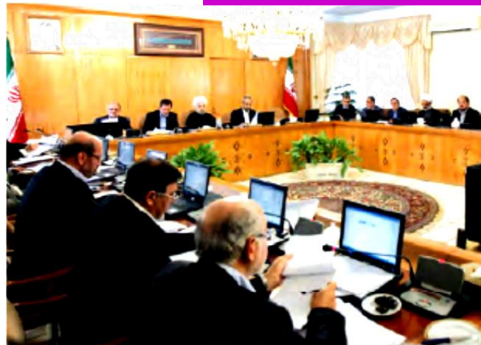
جلسه‌ی رئیس‌جمهور و هیئت وزیران