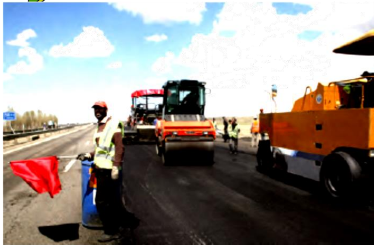
ساختن جاده توسط دولت

قوه‌ی مجریه همان دولت است. دولت از رئیس‌جمهور و هیئت وزیران تشکیل شده است. رئیس‌جمهور هر چهار سال یک‌بار با رأی مردم انتخاب می‌شود. دولت کارهای مختلفی انجام می‌دهد؛ برای مثال، ساختن جاده، پل، بیمارستان، کمک به کشاورزی و صنایع، فراهم کردن امکانات برای آموزش و پرورش و بهداشت و درمان مردم، صادرات و واردات، روابط با کشورهای خارجی و حفظ امنیت مردم.