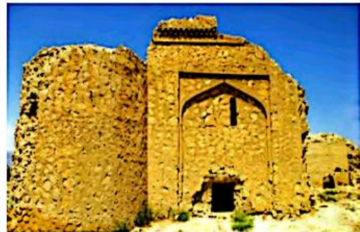
▲ بقایای کاروان سرای رباط قره عشق، خراسان شمالی