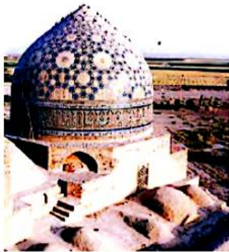
▲ مسجد جامع ساوه

● در این دوره، همچنین مساجد، برج ها، مناره ها و کاروان سراهای باشکوهی بنا شدند.