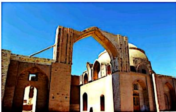
۸ مسجد جامع رُشتخوار، استان خراسان رضوی، به‌جا مانده از دوره‌ی خوارزمشاهیان

ج ۴ (پس از مرگ سلطان ملکشاه سلجوقی، بین جانشینان او اختلاف افتاد و حکومت سلجوقی ضعیف شد. سرانجام، یکی از فرمانروایان منطقه‌ی خوارزم، آخرین سلطان سلجوقیان را شکست داد و حکومت خوارزمشاهیان را ایجاد کرد) مهم‌ترین سلطان خوارزمشاهیان، سلطان محمد بود. در زمان او، قلمرو ایران از سمت شرق گسترش یافت و کشور ما با مغول‌ها همسایه شد. حکومت خوارزمشاهیان با حمله‌ی مغول‌ها به ایران، برچیده شد.)