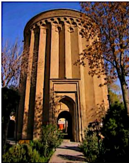
۸ برج طغرل در شهر ری