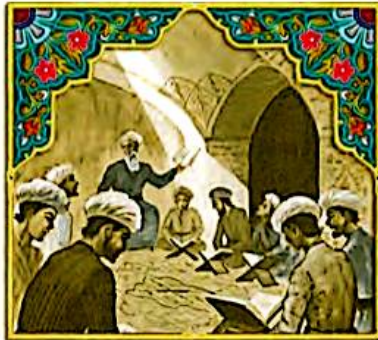
▲ تصویر مدرسه ی نظامیه

ج ۷) ● در دوره ی سلجوقیان، به دستور خواجه نظام الملک مدارس به نام «نظامیه» در شهرهای بزرگ ساخته شد.