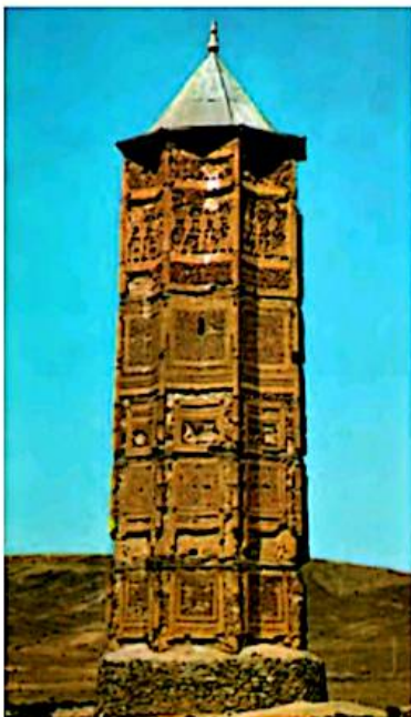
مناره‌ی دوره‌ی غزنویان غزنین، افغانستان