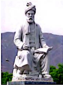
▲ فردوسی شاعر بزرگ ایرانی

از جمله شاعران ایرانی معروف دوره ی غزنویان، ابوالقاسم فردوسی است. آیا نام اثر