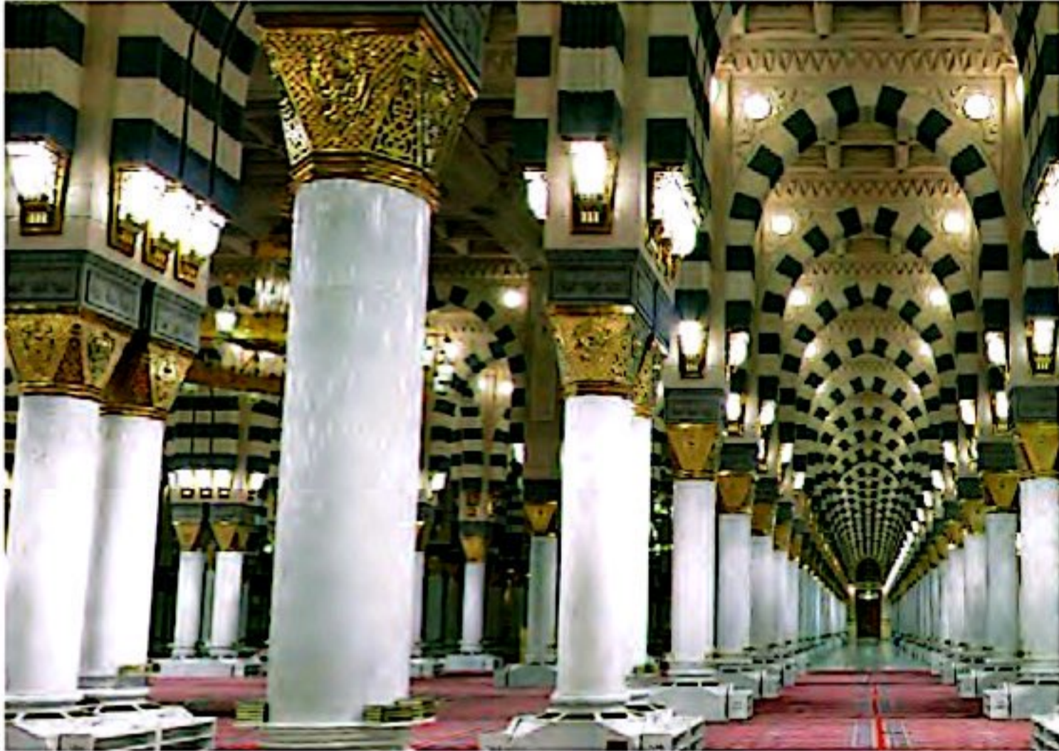
مسجد النبی، نمای داخلی

ف-۳ خانه، غذا و لباسش ساده بود. هرگز خود را از دیگران برتر نمی دانست. نسبت به دوستان و مؤمنان، مهربان و نسبت به کافران و دشمنان، سرسخت بود و کودکان را بسیار دوست داشت. پیامبر همواره با چهره‌ی خندان و اخلاق خوش با مردم روبه‌رو می‌شد. رفتار و کردار ایشان بهترین سرمشق و الگو برای ماست.