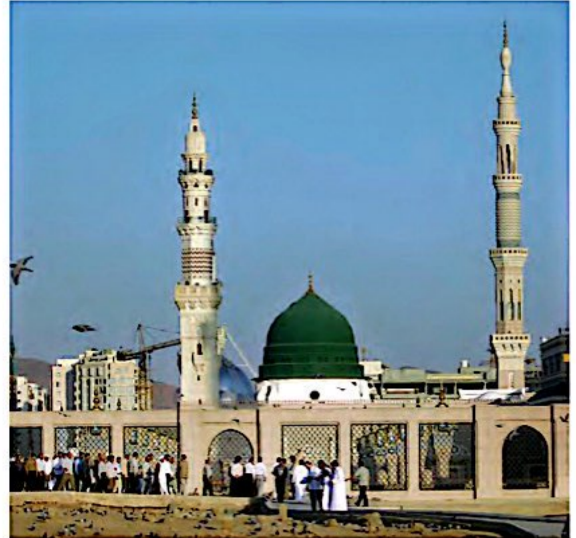
مسجد النبی، نمای بیرونی

زمان زیادی از شب گذشته بود اما بچه‌ها همچنان با اشتیاق به حرف‌های پدر و مادرشان گوش می‌دادند. مادر به آنها گفت: «بچه‌ها، خیلی از وقت خوابتان گذشته است.» سارا گفت: «مادر! پدر! خوش به حالتان! چه سفر خوبی داشته‌اید! کاش روزی ما هم خانه‌ی خدا را زیارت کنیم.»