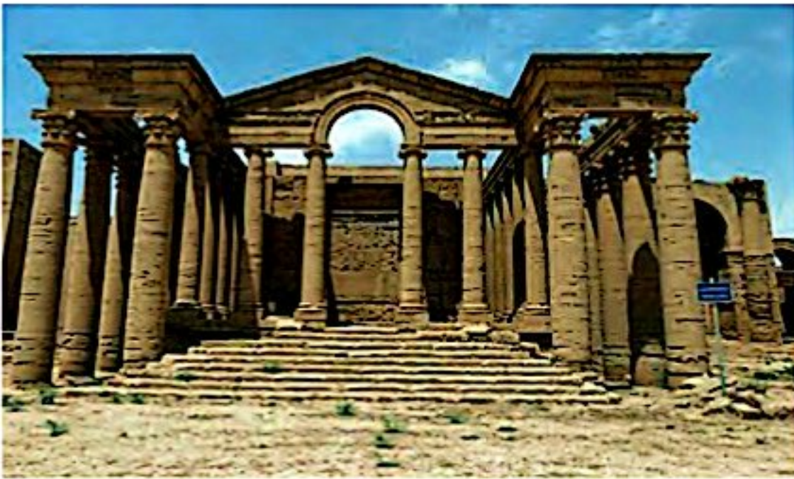
شهر تاریخی نمرود در نزدیکی موصل

(بیشتر مردم عراق مسلمان‌اند و بیش از نیمی از جمعیت این کشور را شیعیان تشکیل می‌دهند. اکثر مردم عراق به زبان عربی صحبت می‌کنند) مردم عراق در سال‌های حکومت «صدام»، حاکم ظالم این کشور، زندگی سختی داشتند. حکومت صدام در سال ۱۳۵۹ به کشور ما حمله کرد و باعث شروع جنگی شد که هشت سال طول کشید (حکومت صدام، پس از اشغال نظامی کشور عراق توسط آمریکا سرنگون شد). (از آن زمان تاکنون نیز مردم عراق به دلیل جنگ‌های داخلی و حضور گروه‌های خارجی، در ناامنی به سر می‌برند و وضع اقتصادی و اجتماعی مناسبی ندارند.)