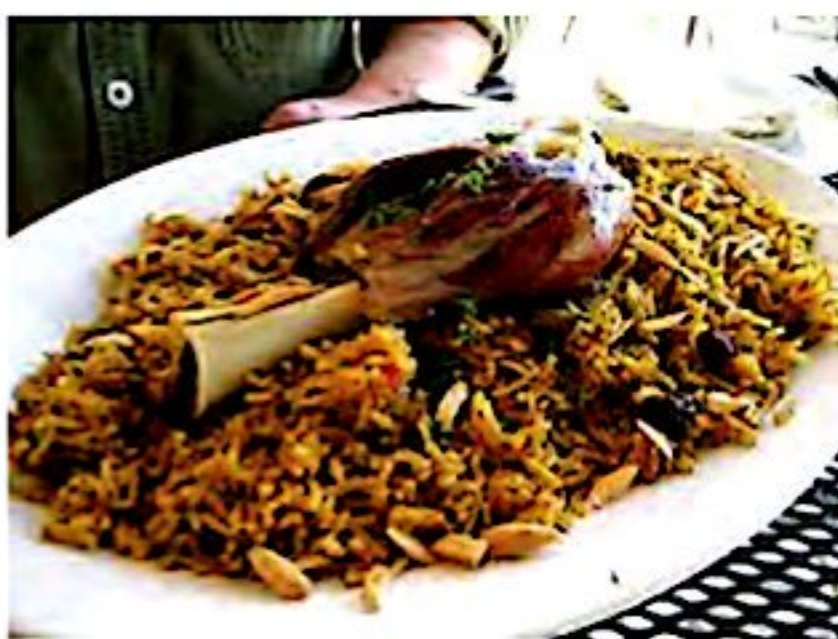
یکی از غذاهای محلی عراق

(حدود چهار هزار سال پیش، تمدن‌های بزرگی مانند سومر، آکد و آشور در سرزمین بین‌النهرین (میان دو رود دجله و فرات) به وجود آمدند. به همین دلیل، در این کشور بناها و آثار باستانی زیادی وجود دارد.)