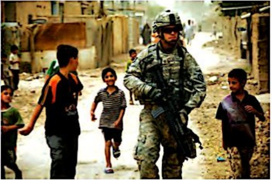
حضور نظامیان در عراق

(عراق کشوری نفت‌خیز است و از تولید و صادرات نفت، درآمد زیادی دارد) (مهم‌ترین محصول کشاورزی عراق، خرماست و در این کشور، نخلستان‌های زیادی وجود دارد)