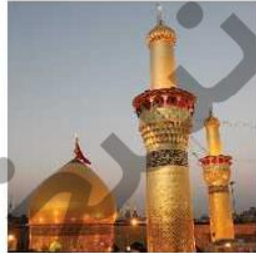
حرم امام علی (ع) - عراق (نجف اشرف)