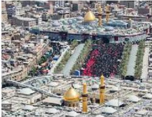
بین الحرمین - عراق (کربلا معلی)