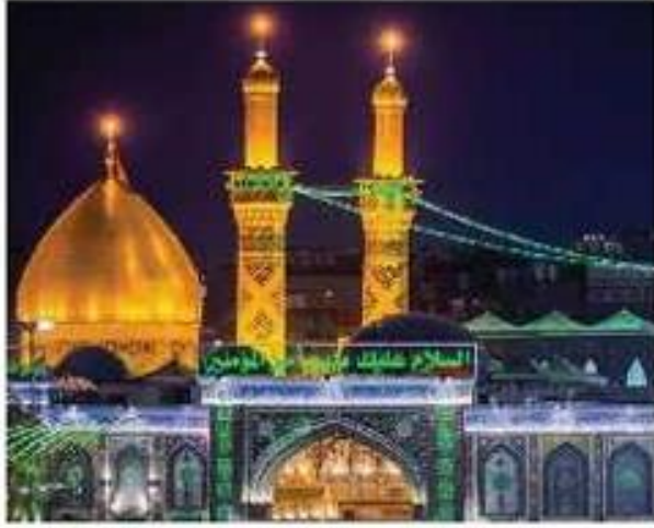
حرم امام حسین (ع) - عراق (کربلا معلی)