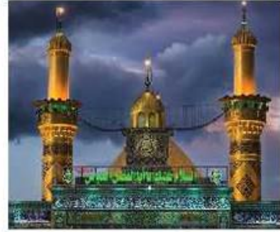
حرم حضرت ابوالفضل (ع) - عراق (کربلا معلی)