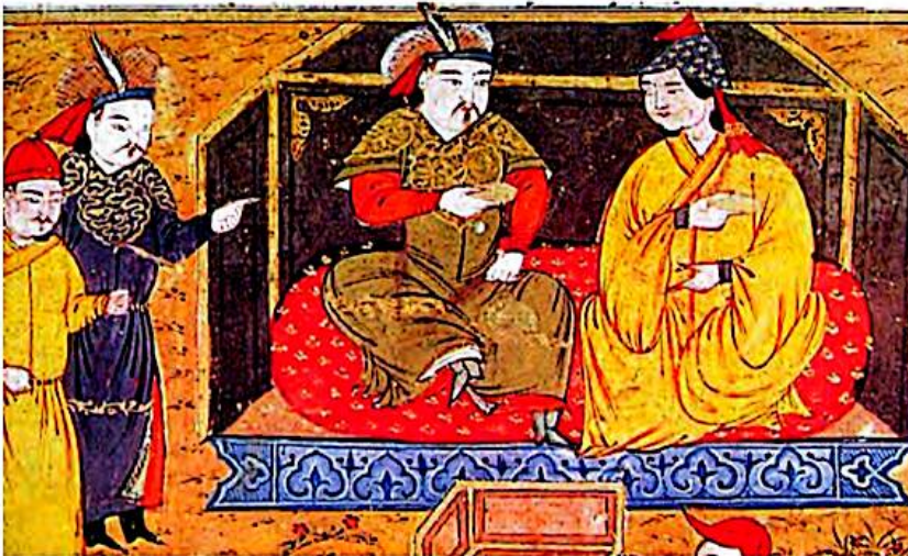
۸ نقاشی مینیاتور، هلاکو خان