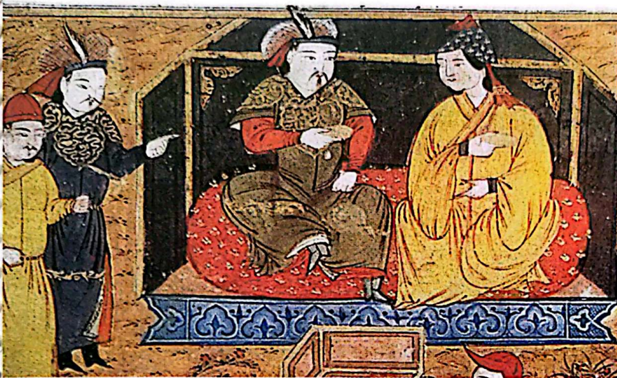
نقاشی مینیاتور، هلاکوخان