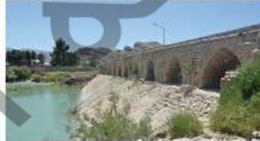
پند امیر در فارس که به دستور عضدالدوله (آل‌بویه) ساخته شد.