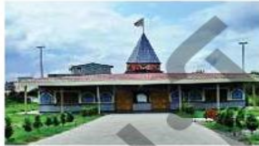
آرامگاه ناصرالدین آطروش، از امیران دوره‌ی علوی، آمل (استان مازندران)

فرمانروایان آل‌بویه و طاهریان به آبادانی بسیار علاقه داشتند و از کشاورزان حمایت می‌کردند. آن‌ها با ساخت بیمارستان مهمی در بغداد و دانشگاه طب به آموزش طب پرداختند. ابوعلی سینا دانشمند بزرگ ایرانی، وزیر یکی از شاهزادگان آل‌بویه بود و در زمان آل‌بویه مراکز علمی شیعه گسترش یافت.