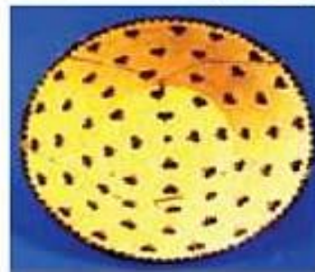
نارف سفالی کشف شده از دوره‌ی طاهریان در نیشابور (خراسان رضوی)