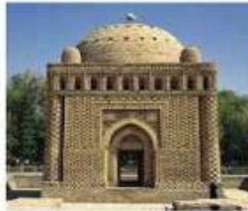
مقبره‌ی امیر اسماعیل سامانی، بخارا، کشور ازبکستان