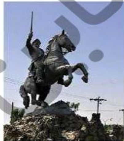
مجشمله‌ی یعقوب لیث صفاری، زابل (سیستان و بلوچستان)