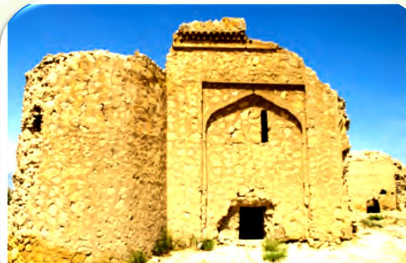
بقایای کاروان‌سرای رباط قره عشق، خراسان شمالی