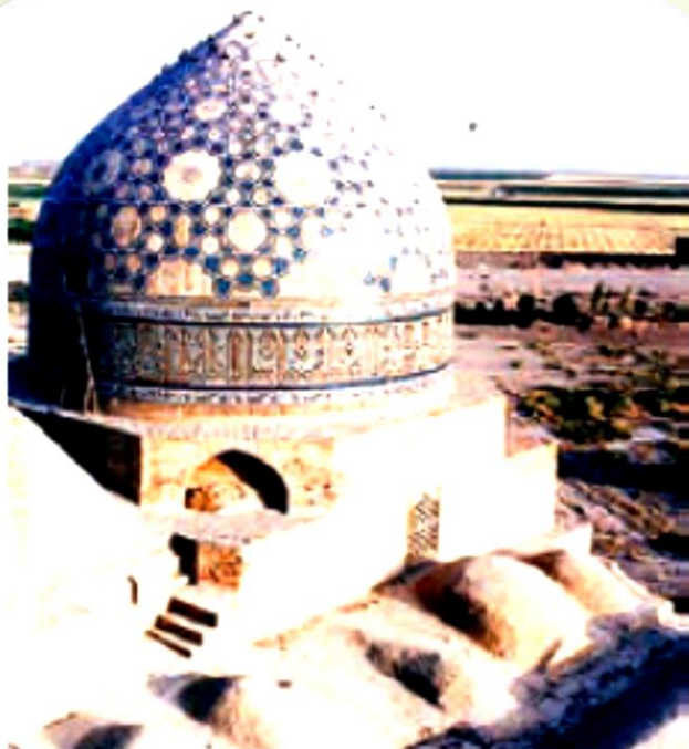
مسجد جامع ساوه

● در این دوره، همچنین مساجد، برج‌ها، مناره‌ها و کاروان‌سراهای باشکوهی بنا شدند.