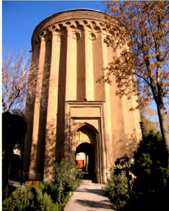
برج طغرل در شهر ری

سلسله‌ی سلجوقیان را طغرل تأسیس کرد. سلجوقیان حکومتی قدرتمند و قلمرو بسیار وسیعی داشتند. به نقشه‌ی صفحه‌ی بعد توجه کنید. در زمان سلطان ملکشاه سلجوقی، قلمرو سلجوقیان از شرق تا ماوراءالنهر و از غرب تا دریای مدیترانه گسترش یافت. پایتخت سلطان ملکشاه، شهر اصفهان بود.