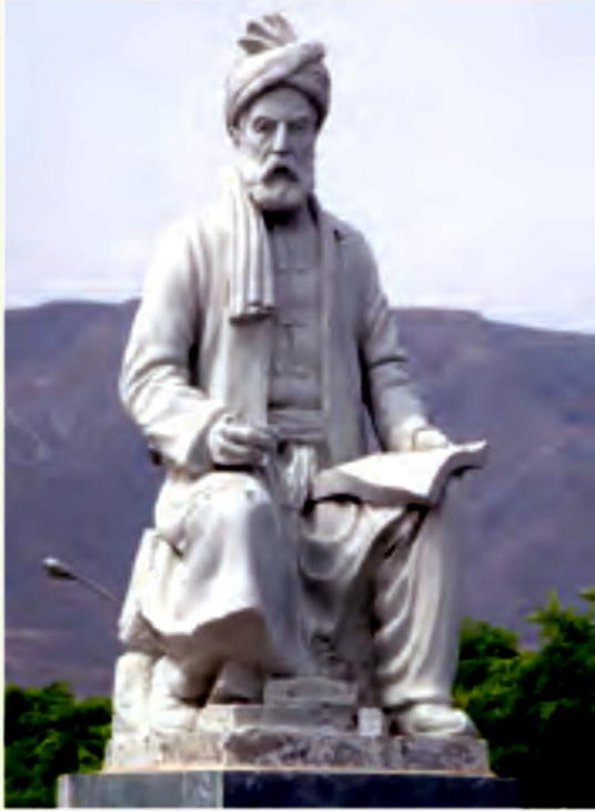
فردوسی شاعر بزرگ ایرانی