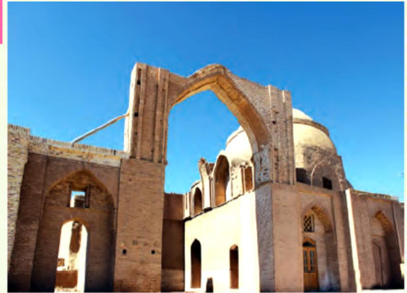
▲ مسجد جامع رُشتخوار، استان خراسان رضوی، به‌جا مانده از دوره‌ی خوارزمشاهیان

پس از مرگ سلطان ملکشاه سلجوقی، بین جانشینان او اختلاف افتاد و حکومت سلجوقی ضعیف شد. سرانجام، یکی از فرمانروایان منطقه‌ی خوارزم، آخرین سلطان سلجوقیان را شکست داد و حکومت خوارزمشاهیان را ایجاد کرد. مهم‌ترین سلطان خوارزمشاهیان، سلطان محمد بود. در زمان او، قلمرو ایران از سمت شرق گسترش یافت و کشور ما با مغول‌ها همسایه شد. حکومت خوارزمشاهیان با حمله‌ی مغول‌ها به ایران، برچیده شد.