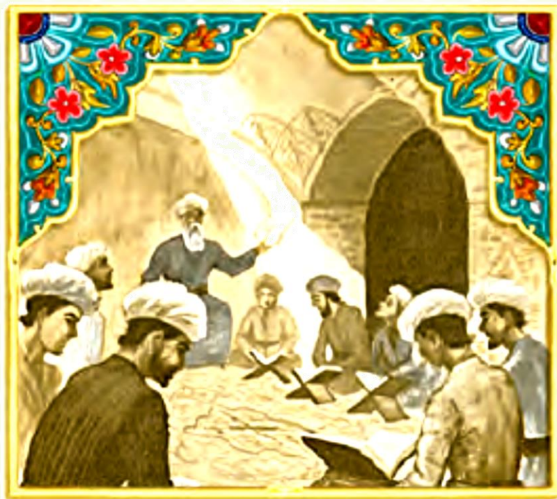
△ تصویر مدرسه‌ی نظامیه