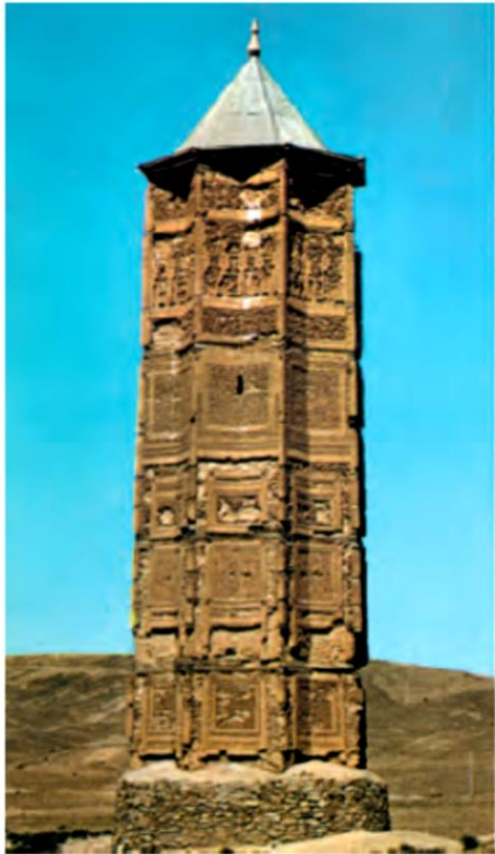
مناره‌ی دوره‌ی غزنویان غزنین، افغانستان

مشهورترین فرمانروای غزنوی، سلطان محمود غزنوی بود. یکی از کارهای مهم سلطان محمود، لشکرکشی به هند بود. او چند بار به آن سرزمین لشکر کشید؛ در آنجا بت‌خانه‌ها را خراب کرد و گنج‌های فراوانی را به غارت برد و بعد به ایران بازگشت. پس از سلطان محمود، پسرش سلطان مسعود به حکومت رسید.