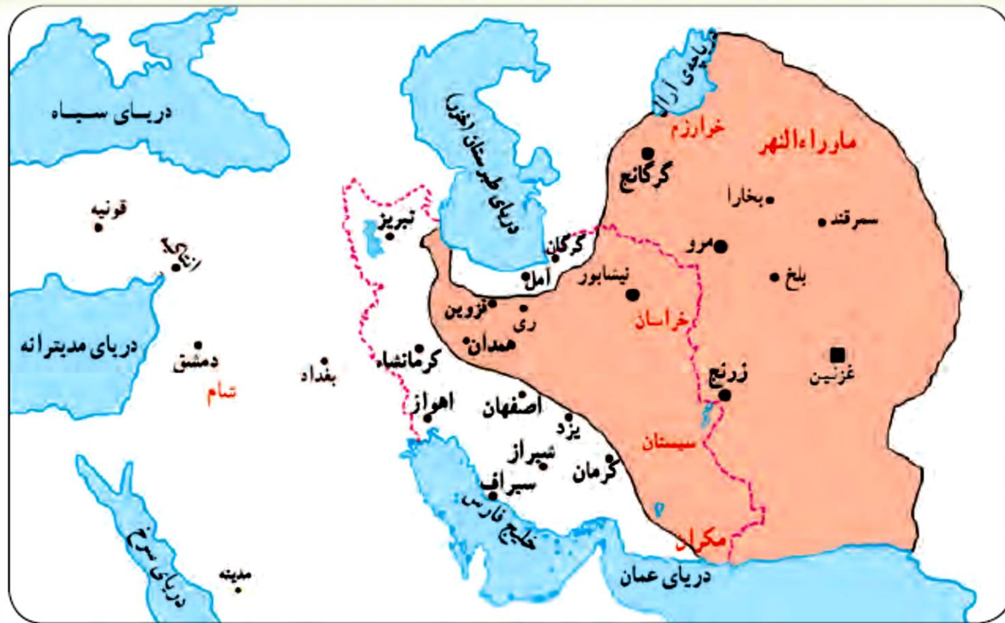
■ قلمرو غزنویان --- مرزهای ایران کنونی ■ پایتخت