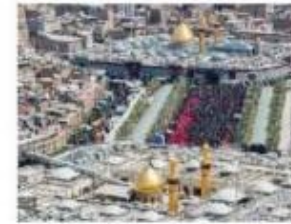
بین الحرمین - عراق (کربلا معلی)