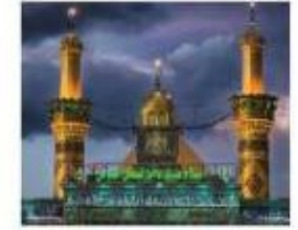
حرم حضرت ابوالفضل (ع) - عراق (کربلا معلی)