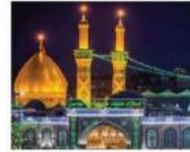
حرم امام حسین (ع) - عراق (کربلا معلی)