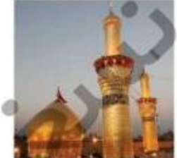
حرم امام علی (ع) - عراق (نجف اشرف)