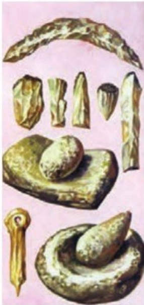
ابزارهای سنگی اولیه برای کشاورزی و آرد کردن گندم و جو

کشاورزی هم مانند کشف آتش زندگی انسان را تغییر داد. پیش از آن، انسان‌ها مجبور بودند برای به دست آوردن غذا از جایی به جای دیگر بروند اما با رواج کشاورزی، مردم در کنار رودها و چشمه‌ها برای خود خانه‌های دائمی ساختند و در یکجا ساکن شدند.