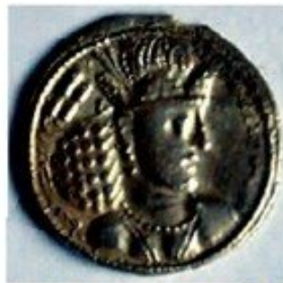
سکه برای خرید و فروش