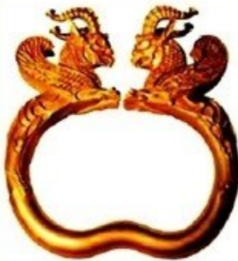
دستبند یا بازوبند

به تصویرها نگاه کنید و حدس بزنید که این وسایل چیستند؟ ایرانیان باستان از هر کدام از این وسایل چه استفاده‌ای می‌کرده‌اند؟