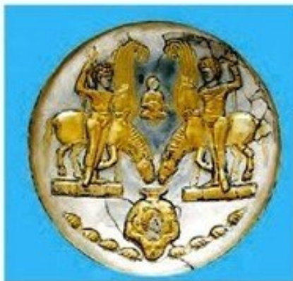
لوح سنگی یا سکه