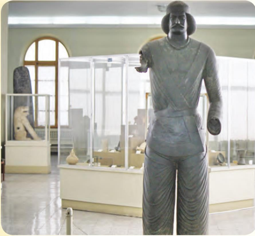
مجسمه‌ی مرد پارتی در موزه‌ی ایران باستان

این جنگ‌ها رومی‌ها شکست خوردند. پارت‌ها در فنون جنگی و اسب سواری و تیراندازی بسیار ماهر بودند.