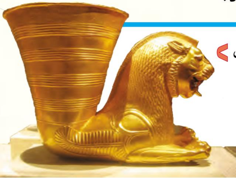
ظرف طلایی هخامنشی

در چاپارخانه‌ها همیشه اسب‌های تازه‌نفس آماده‌ی حرکت بودند. پیک‌ها (نامه‌رسان‌ها) در آنجا اسب خود را عوض می‌کردند و سوار بر اسب‌های تازه‌نفس، نامه‌ها را به دورترین نقاط کشور می‌رساندند. از دیگر کارهای مهم داریوش این بود که دستور داد سکه‌هایی از طلا بسازند. او همچنین یک سپاه ده‌هزار نفری از سربازان ورزیده، که همیشه آماده‌ی جنگ بودند، تشکیل داد.