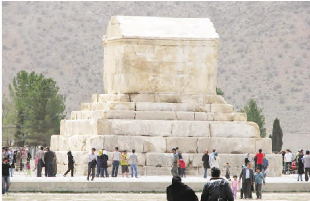
مقبره‌ی کوروش - پاسارگاد

پاسارگاد در حدود ۱۳۰ کیلومتری شیراز قرار دارد. وقتی اتومبیل به پاسارگاد رسید، همه پیاده شدند. پویا به اطراف نگاهی کرد و گفت: ببینید، آرامگاه کوروش در اینجا قرار دارد. در این مکان آثار تاریخی دیگری هم هست. علیرضا پرسید: کوروش که بود؟ پویا جواب داد: کوروش مردی از قوم پارس بود او پس از جنگ‌های