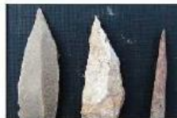
ابزار سنگی (این اشیاء در موزه‌ی ملی موجود است.)