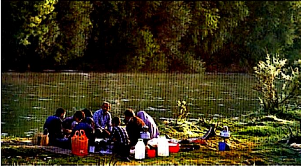
گیاهان موجب زیبایی محیط می‌شوند. مردم می‌توانند در محیط‌های زیبا و سرسبز استراحت و تفریح کنند و از زیبایی‌های طبیعت لذت ببرند.

سال‌های قبل خواندید، فواید گیاهان و جانوران را بیان کنید؟ گیاهان و جانوران منابع غذایی برای انسان‌ها و سایر جانوران هستند بدون گیاهان و جانوران زندگی انسان‌ها به خطر می‌افتد. اکسیژن موجود در هوا را گیاهان تولید می‌کنند. بعضی از داروها از گیاهان به دست می‌آیند. از چوب درختان برای ساختن خانه‌ها و ابزار آلات و از الیاف گیاهان برای پوشاک استفاده می‌کنیم. از پوست جانوران برای تهیه وسایل مختلف و پوشاک استفاده می‌شود.