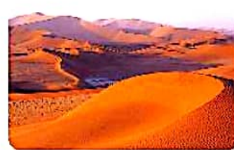
۳. بی‌همتا ترین