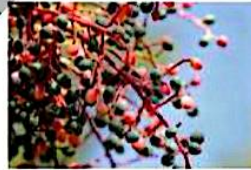
«درخت پسته کوهی»