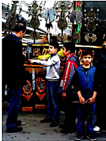
عزاداری‌های تاسوعا و عاشورا