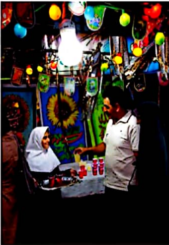
جشن نیمه شعبان

به تصویرهای زیر توجه کنید. این تصویرها چه روزهایی را نشان می‌دهند؟