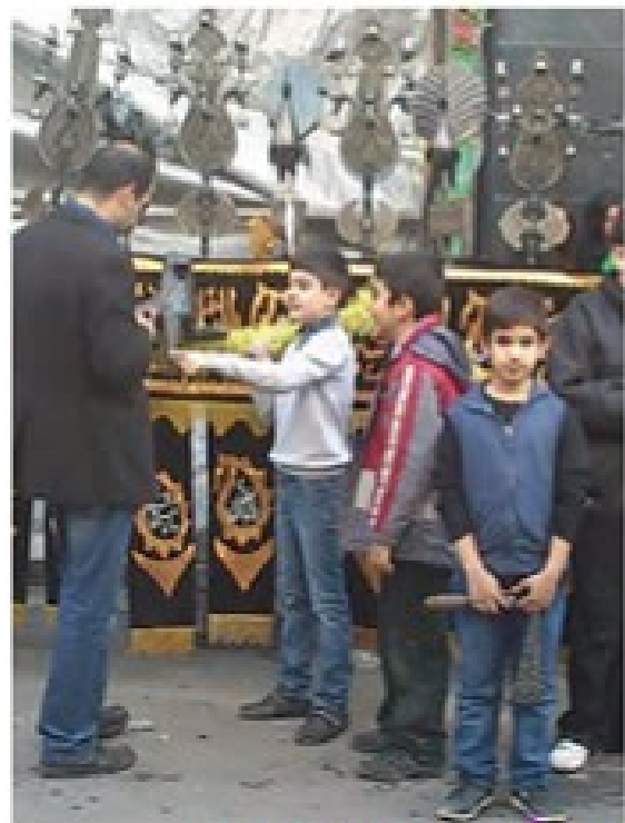
سوگواران عاشورا در کربلا