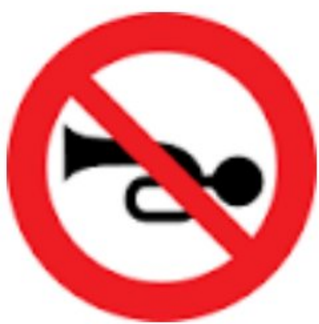
بوق زدن ممنوع

۵- هریک از تابلوهای زیر چه نشانه ای هستند و چه پیامی برای ما دارند؟