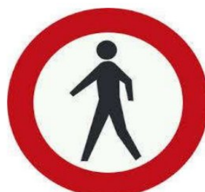
عبور عابر پیاده ممنوع