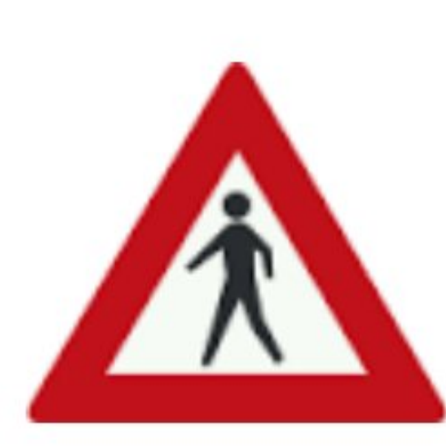
محل عبور عابر پیاده