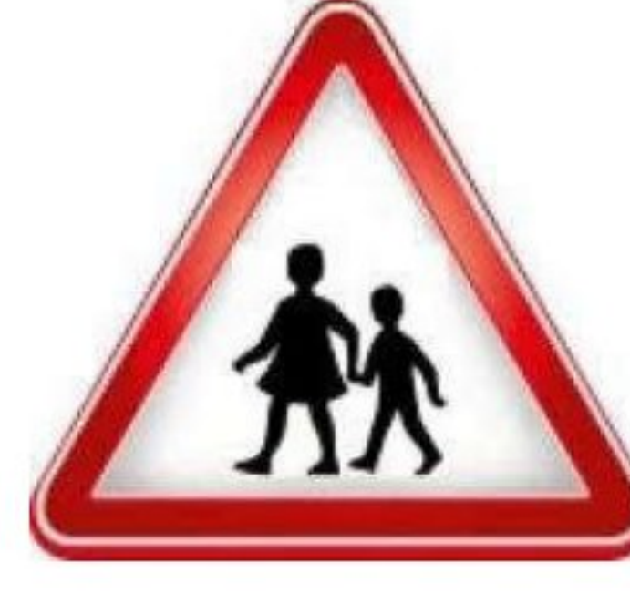
محل عبور دانش آموزان