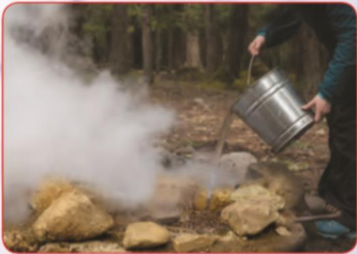
احتیاط و پیشگیری از آتش سوزی