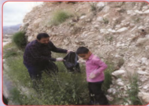
نظافت و پاکیزگی