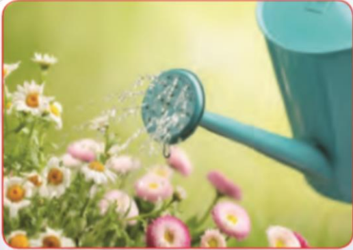
آبیاری و مراقبت

در هر تصویر چه می بینی؟ با کمک دوستانت برای هر کدام، نام مناسبی انتخاب کنید.