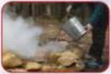
خاموش کردن آتش

در هر تصویر چه می بینی؟ با کمک دوستانت برای هر کدام، نام مناسبی انتخاب کنید.