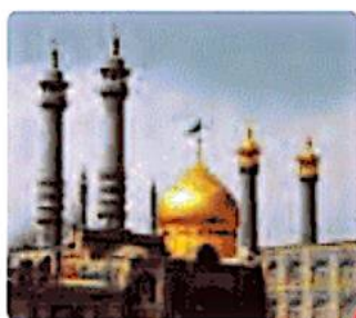
مرقد حضرت معصومه (سلام الله علیها)