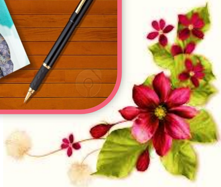
گروه پنجم (دبستان علوی_ شعبه میدان امامت)