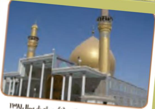
حرم امام حسن عسکری (ع)، سامرا، سال ۱۳۸۱ هجری شمسی