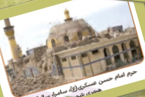
حرم امام حسن عسکری (ع)، سامرا، سال ۱۳۸۴ هجری شمسی