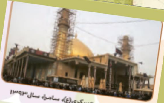
حرم امام حسن عسکری (ع)، سامرا، سال ۱۳۹۱ هجری شمسی

با کمک اعضای خانواده درباره‌ی این تصاویر، متنی کوتاه بنویسید و در کلاس بخوانید. اطلاعات زیر را درباره‌ی زندگی امام حسن عسکری علیه‌السلام جمع‌آوری کنید و به کلاس گزارش دهید.