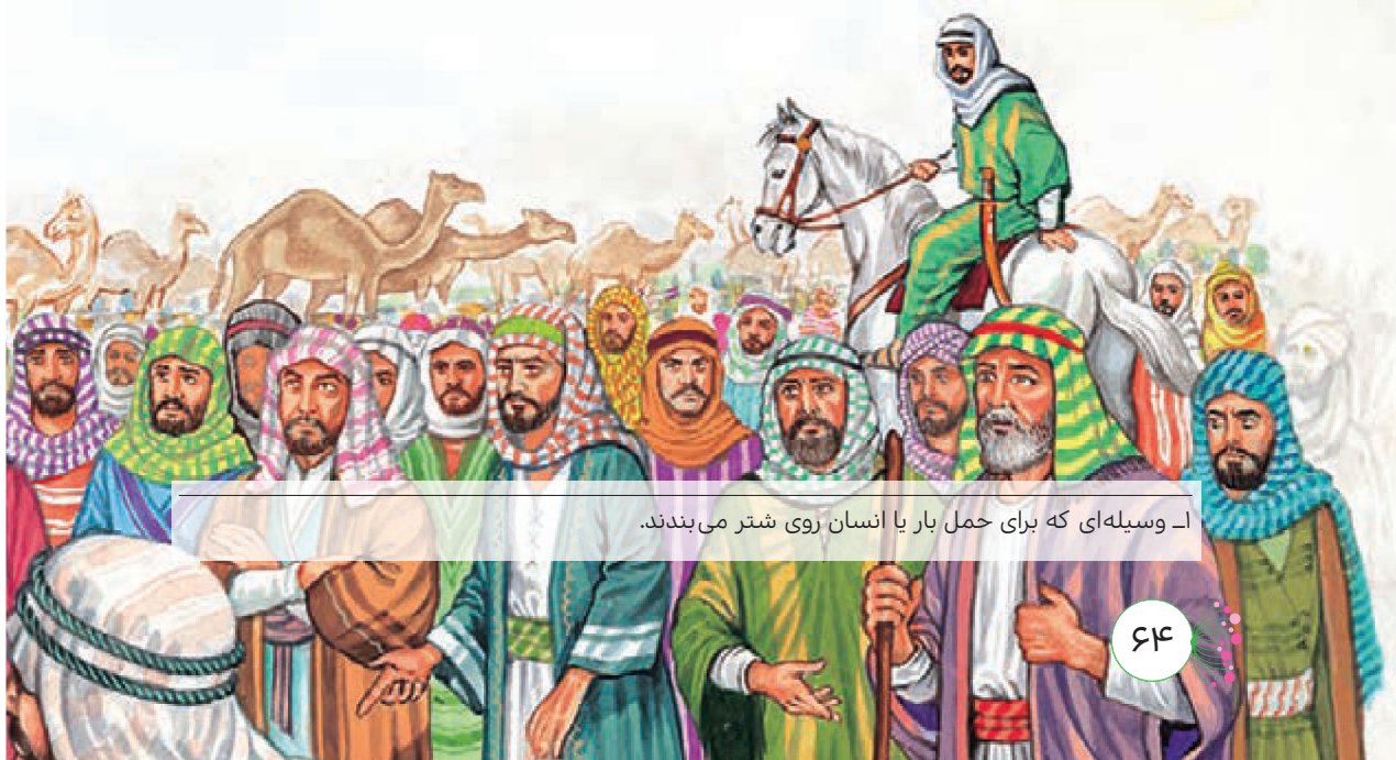
۱- وسیله‌ای که برای حمل بار یا انسان روی شتر می‌بندند.

مردم با شور و هیجان به پیامبر چشم دوخته‌اند و گوش می‌کنند.