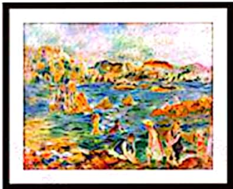
قاب باریک، پاسپار توی باریک: پاسپارتو زیادی باریکه!