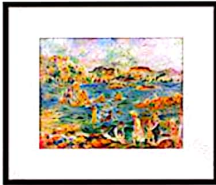
قاب باریک، پاسپارتو متوسط: ظاهر کلاسیک!