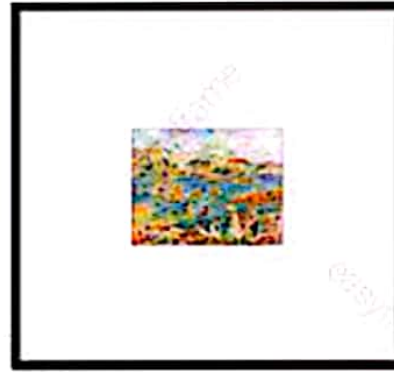
قاب باریک، پاسپارتو بهین: ظاهر جذاب و مدرن