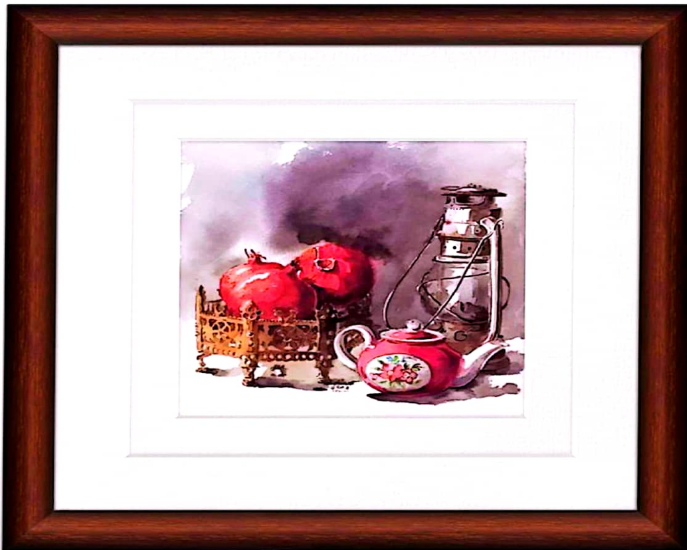
تصویر قاب شده اثر همراه با پاسپارتو دوبل - اثر استفاده شده در این آموزش بخشی از نقاشی آبرنگ استاد علی اکبر صادقی است