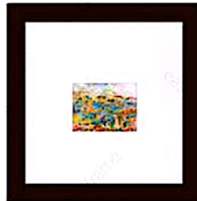
قاب بهین، پاسپارتو بهین: قاب نگاه رو از تصویر دور می‌کنه