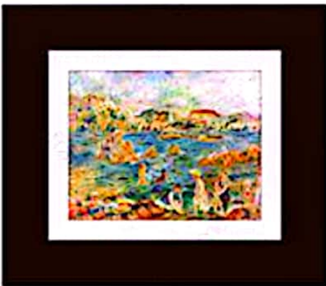
قاب بهین، پاسپارتو باریک: قاب به تصویر غلبه می‌کنه