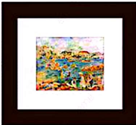
قاب بهین، پاسپارتو متوسط: رقابت قاب و پاسپارتو در جلب توجه