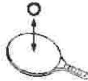
نحوه ضربه زدن