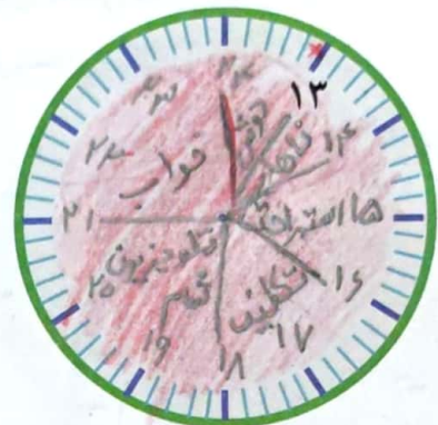
بعد از ظهر

۲- نوارهای رنگی مربوط به ساعت‌های قبل از ظهر و بعد از ظهر (کار در کلاس) را بریده‌ایم و روی یک خط به دنبال هم چسبانده‌ایم. با رنگ کردن، کارهای زهر را در روز جمعه مشخص کنید.