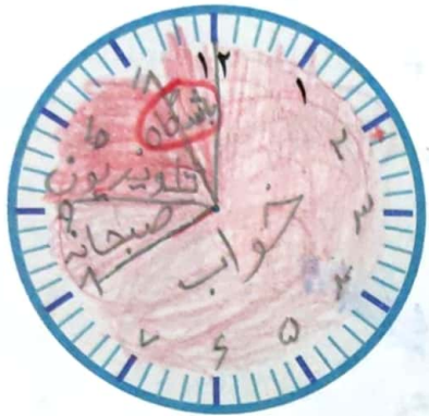
قبل از ظهر

۱- کارهایی را که در یک روز پنجشنبه انجام داده‌اید، روی ساعت‌های زیر مشخص کنید. ابتدا ساعت‌ها را کامل کنید.