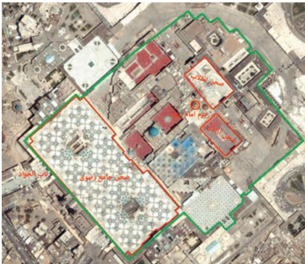
هر یک سانتی متر بر روی نقشه برابر ۳۳ متر بر روی زمین است.