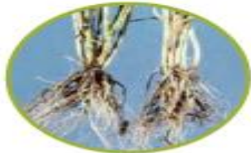
ریشه ی گندم