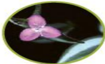
گل برگ بیدی