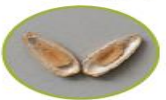
دانه‌ی آفتابگردان دو قسمت شده