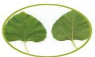
برگ گیاه آفتابگردان