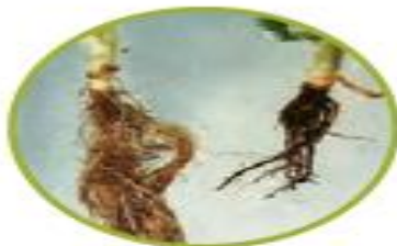
ریشه ی ذرت