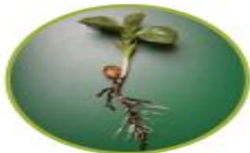
ریشه ی لوبیا