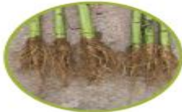
ریشه ی آفتابگردان