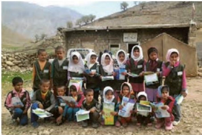
..... کارنامه پایان سال