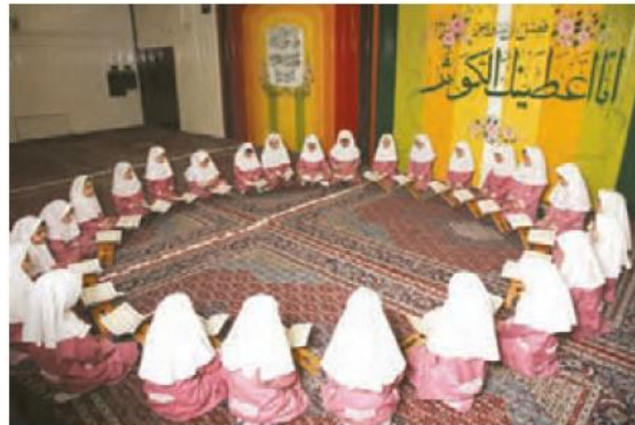
..... قرائت قرآن