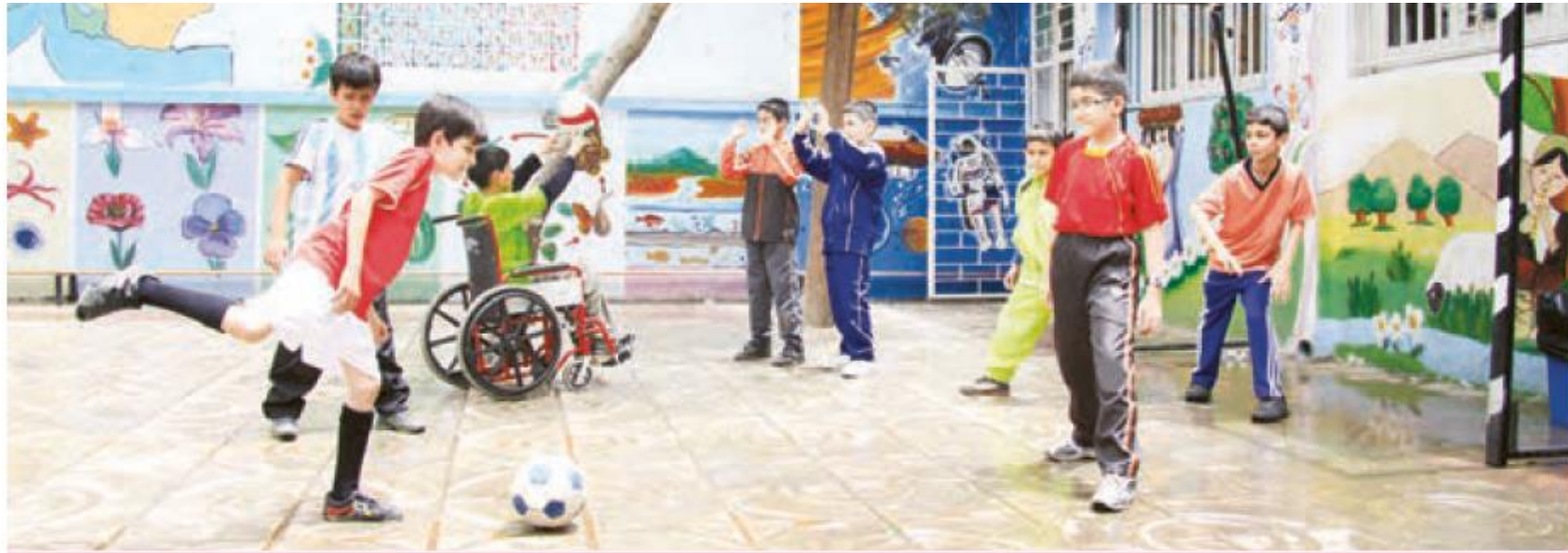
..... زنگ ورزش (بازی فوتبال)