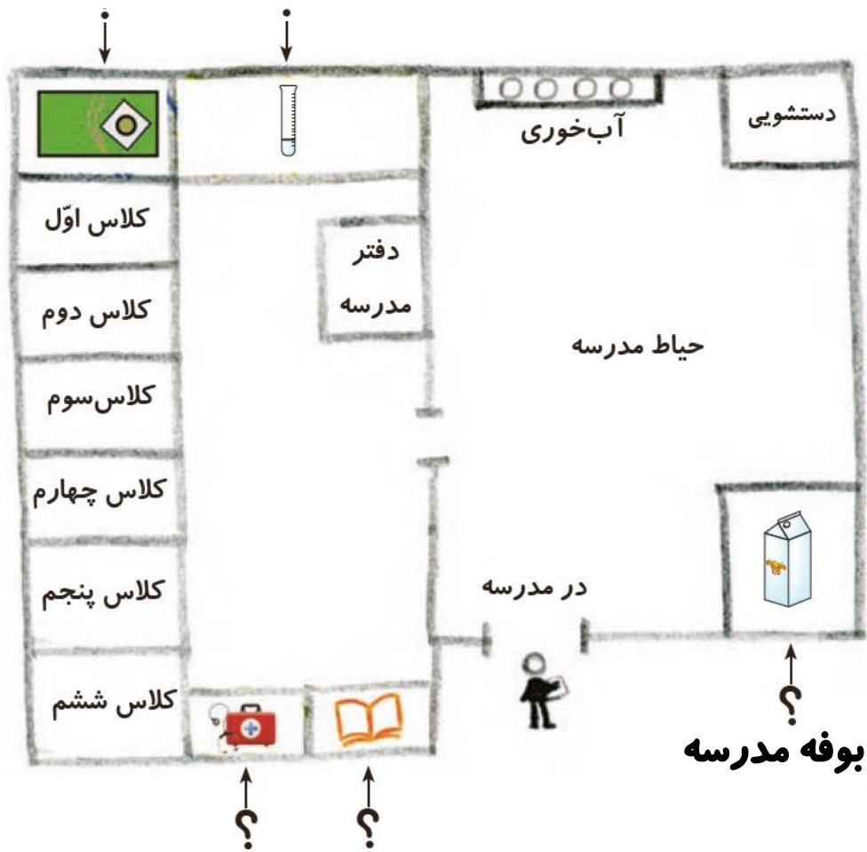
نقشه‌ی مدرسه‌ی رازی