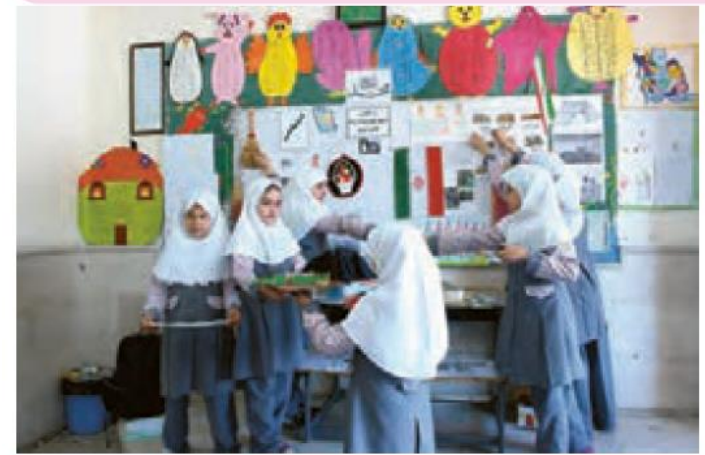
..... مراسم جشن ۲۲ بهمن