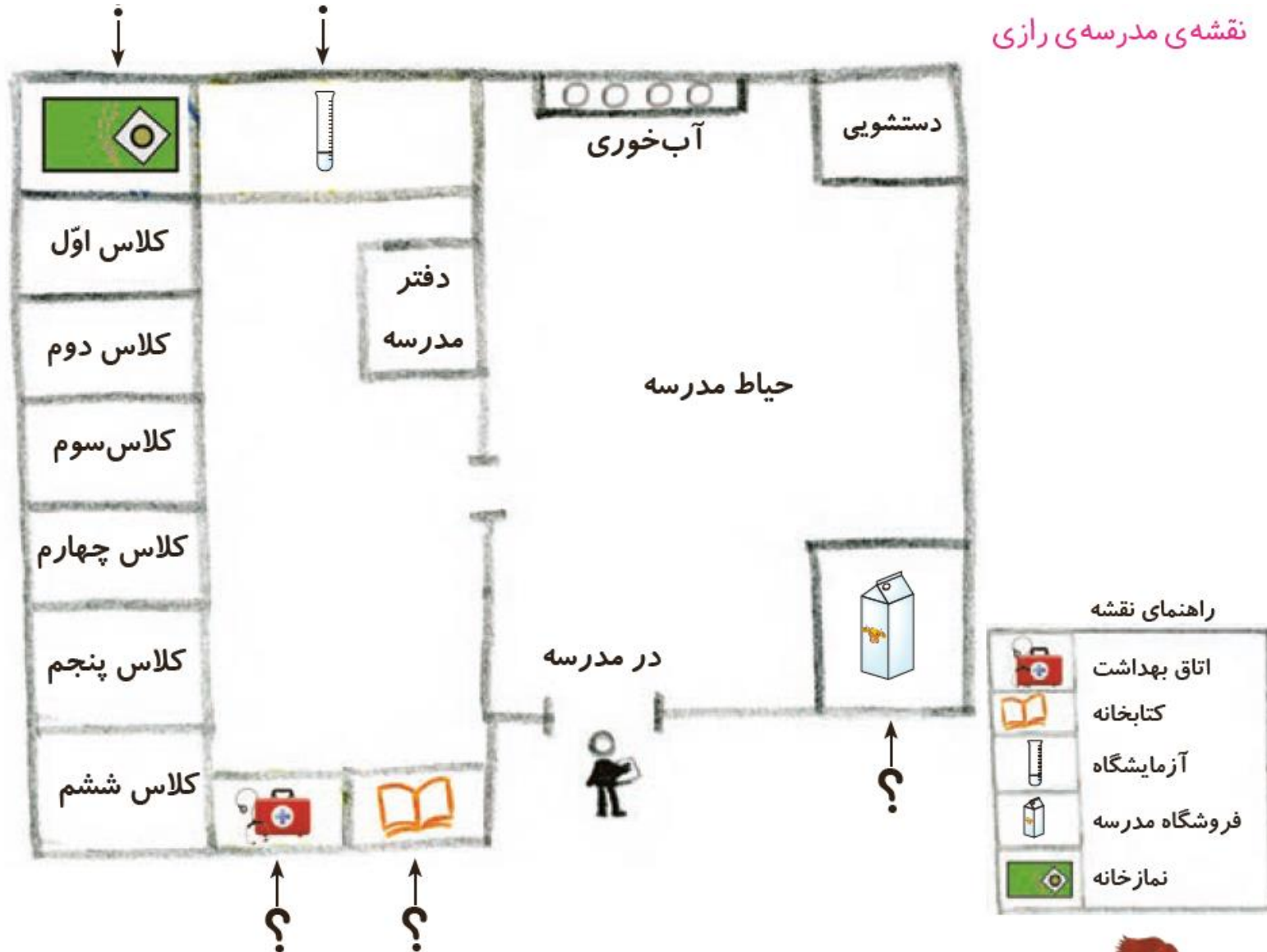
نقشه‌ی مدرسه‌ی رازی

بچه‌های مدرسه‌ی رازی با کمک معلم، نقشه‌ی ساده‌ای از مدرسه خودشان کشیدند. آن‌ها در این نقشه، قسمت‌های مختلف مدرسه‌شان را نشان دادند.