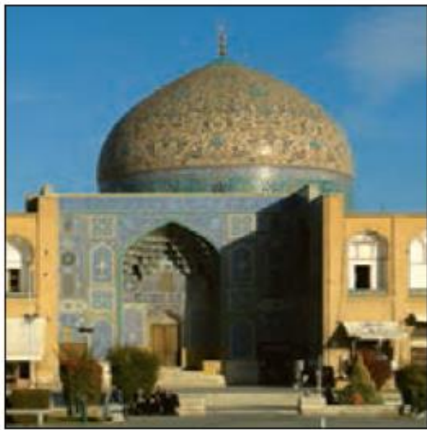
مسجد شیخ لطف الله

این مسجد به فرمان شاه عباس ساخته شد تا شیخ لطف الله که عالم بزرگی بود در آن نماز جماعت برگزار کند و به تربیت و تدریس شاگردان پردازد. ساختن این مسجد حدود ۱۸ سال طول کشید. مسجد شیخ لطف الله گنبد بسیار زیبایی دارد که روی آن کاشی کاری های بی نظیری دیده می شود. گنبد یکی از نشانه های معماری اسلامی است.