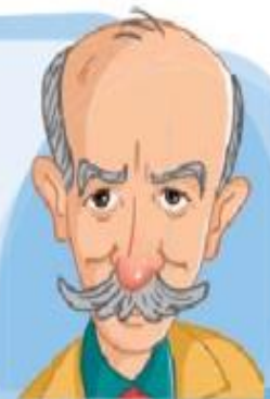
علی اکبر دهخدا

یکی از سرداران بزرگ و دلیر ایران در زمان هخامنشیان بود. او در حمله‌ی اسکندر به ایران، شجاعت‌های زیادی از خود نشان داد و در برابر سپاه اسکندر تسلیم نشد. سرانجام نیز از جان خود گذشت تا ایران را از چنگال دشمنان نجات دهد.