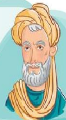
محمد بن زکریای رازی

او پزشک، فیلسوف و شیمی دان معروف ایرانی است که آثار ماندگاری در زمینه‌ی پزشکی، شیمی و فلسفه دارد. رازی را کاشف الکل و جوهر گوگرد می دانند.