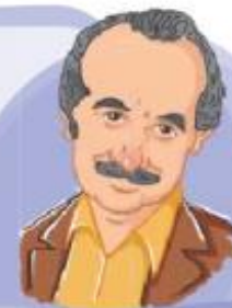
شهید مسعود علی محمدی

او استاد دانشگاه، فیزیک‌دان و دانشمند هسته‌ای ایران بود. مردی پارسا، باتقوا و خانواده‌دوست که برای پیشرفت ایران بسیار تلاش کرد و سرانجام به دست عوامل مزدور اسرائیلی به شهادت رسید.