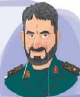
شهید حسن تهرانی مقدم

این دانشمند برجسته‌ی ایرانی، در تهران متولد شد؛ در رشته‌ی مهندسی صنایع به تحصیل پرداخت و لقب پدر موشکی ایران را گرفت. سرانجام بر اثر انفجار مهمات در آزمایش موشکی به شهادت رسید.