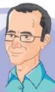
شهید مجید شهریاری

او در شهر ایلام به دنیا آمد و فارغ‌التحصیل مقطع دکترا در رشته‌ی برق بود. فعالیت‌های کاری او در امور اجرایی و همکاری با سازمان انرژی هسته‌ای باعث شهادت او به دست دشمنان شد.