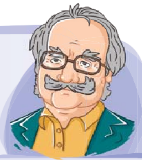
استاد محمود فرشچیان

او در سال ۱۳۰۸ در اصفهان دیده به جهان گشود. پدرش مردی هنردوست بود و او را به استاد امامی سپرد. بعد از آن استاد فرشچیان به اروپا رفت و به مطالعه و بررسی آثار نقاشی غرب پرداخت. وی آثار ارزشمندی از خود برجای گذاشت و آوازه‌ی هنر او در همه‌ی دنیا پیچید. طراح‌ی ضریح مطهر امام رضا(ع) و ضریح منور امام حسین(ع) به قلم ماندگار استاد فرشچیان است. از آثار معروف او «ضامن آهو»، «ستایش» و «عصر عاشورا» است.