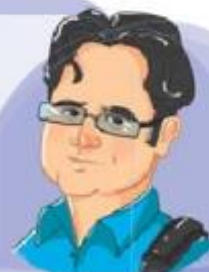
شهید داریوش رضایی نژاد

او در شهر ایلام به دنیا آمد و فارغ‌التحصیل مقطع دکترا در رشته‌ی برق بود. فعالیت‌های کاری او در امور اجرایی و همکاری با سازمان انرژی هسته‌ای باعث شهادت او به دست دشمنان شد.